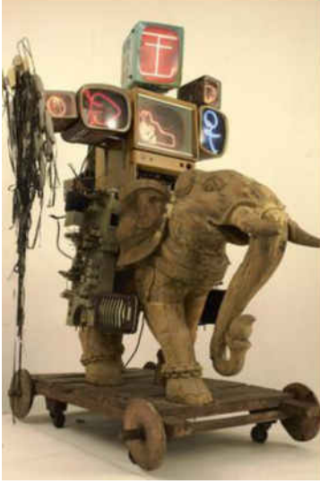
شكل رقم (5) نام جان بايك : الكسندر العظيم