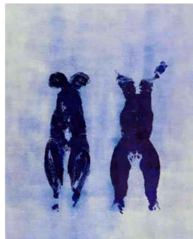
شكل (1) شكل (2)

إيف كلاين: Anthropometrie (ANT: إيف كلاين) 110 إيف كلاين: Anthropometrie: 1962: