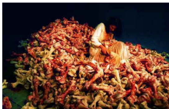
شكل رقم (3,4) : مارينا ابراموفيتش : باروك البلقان